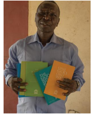
Cursussen in het Engels

deze stam. God gebruikt Zijn Woord in combinatie met de cursus 'Één God, Eén weg' om de ogen van vele moslims te openen voor het Evangelie van Jezus Christus. We zijn zo dankbaar voor Emmaus en uw partnerschap. We zullen u op de hoogte houden hoe God de Bijbelcursussen gebruikt om aanbidders te trekken uit alle stammen, tongen en natiën.'