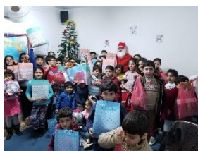
Kinderkerstbijeenkomst in A.

Een echtpaar uit Irak dat in Amman tot geloof is gekomen, is teruggekeerd naar hun woonplaats Erbil en is daar nu getuigen van Christus. Broeder I. is van plan hen in de zomer te bezoeken en hen te helpen een gemeente te stichten.