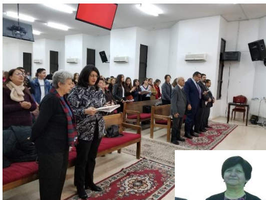
Diploma-uitreiking in M.