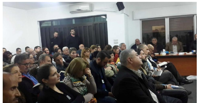
Bijeenkomst in Amman

In Jordanië neemt het werk ook toe. Ten eerste worden de Bijbelcursussen gebruikt in huisgroepen, met de bedoeling dat deze huisgroepen gezamenlijk een nieuwe gemeente gaan vormen. In de bestaande gemeente zijn drie soorten Bijbelstudiegroepen, voor evangelisatie en voor nader onderwijs. Deze groepen komen tegelijk in ons gebouw samen, en de kamers puilen dan uit! Er is een serieuze honger naar God in het Midden-Oosten. Meerderen met een islamitische achtergrond zijn tot geloof gekomen. De Heere zij gedankt!