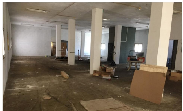
Ons nieuwe gebouw in Nazareth

Indien de Heere een van deze noden op uw hart legt om voor te bidden of aan bij te dragen, kunt u contact met ons opnemen.