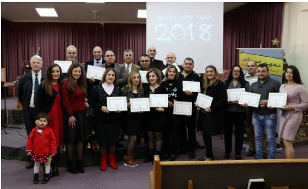
Diploma-uitreiking Bijbelstudiegroep Egypte

Het is goed om te weten dat dit in alle drie de landen gevaarlijk werk is. Want het Evangelie delen met moslims en hen tot het christendom bekeren is tegen de wet en daarmee riskeert men gevangenisstraf of zelfs de dood. Bid voor hun veiligheid.