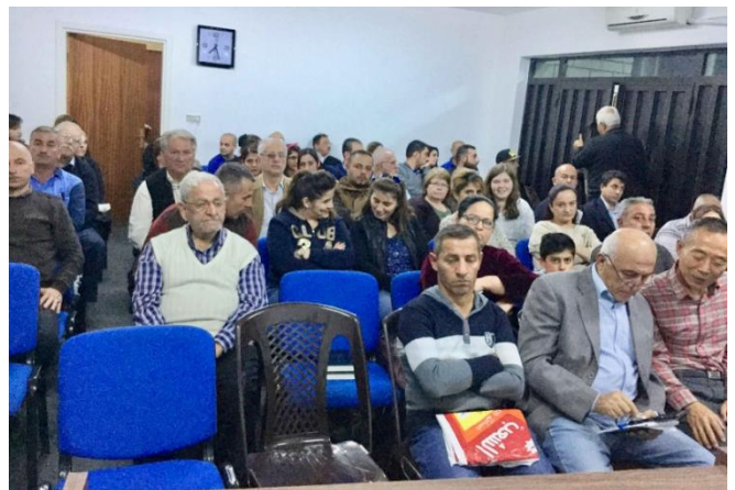
Bijeenkomst in A.

Velen komen tot geloof, ook vanuit het 'andere geloof', en de kerkzaal is vaak gevuld met meer dan 100 man waarbij velen moeten staan. Het is hoognodig dat men een grotere ruimte kan huren. Bid dat men zo'n ruimte vindt en dat de Heere in de huur voorziet. Bid ook om officiële registratie van de gemeente, wat het publiceren van boeken en