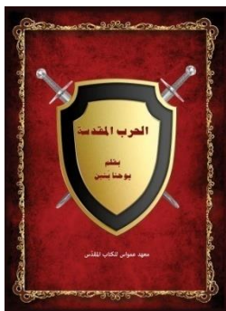
De Heilige Oorlog van Bunyan

Looft de Heere: alle boeken die we in de vorige nieuwsbrief noemden zijn verstuurd en hebben hun bestemming bereikt (behalve Syrië) en wij ontvingen hier in Nazareth Bunyans Heilige Oorlog (foto hieronder) en vijf nieuwe cursussen. En deze boeken zijn ook in Egypte, Jordanië en Libanon aangekomen. We zijn nu met twee andere cursussen bezig en zes andere willen we in 2018 herdrukken.