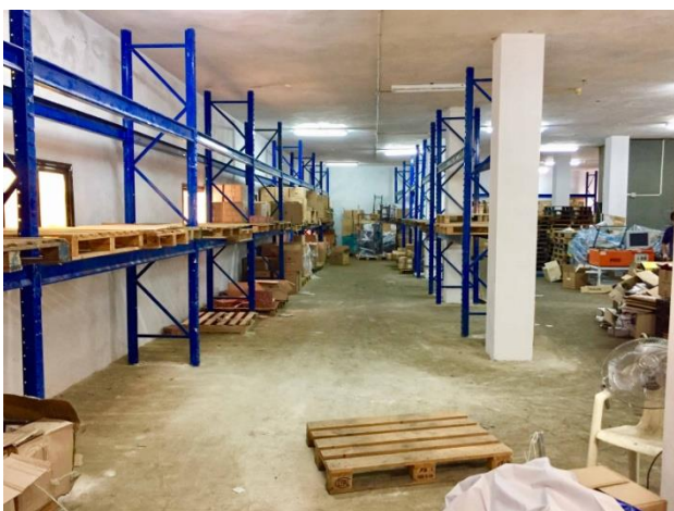
Het nieuwe gebouw

Looft de Heere: hoewel we het kinderkamp in de zomer moesten afzeggen, kunnen we met Kerst (eind december) toch zonder problemen een kinderkamp gaan houden. Bid voor de voorbereidingen waar we mee bezig zijn.